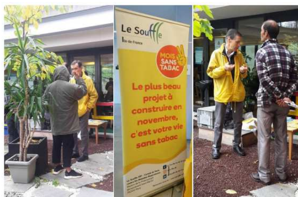
ESI L'Arche d'Avenir – la Mie de Pain

Fiche Oscars : Mois Sans Tabac dans les structures accueillant des personnes en situation de vulnérabilité sociale ou économique - OSCARS : Observation et suivi cartographique des actions régionales de santé (oscarsante.org)